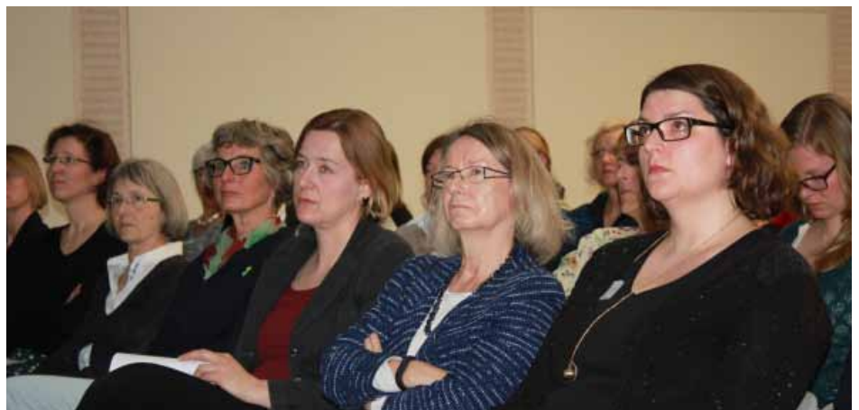
Aufmerksame Zuhörerinnen, darunter auch neu gewählte Landtagsabgeordnete und Evelyne Gebhardt MdEP