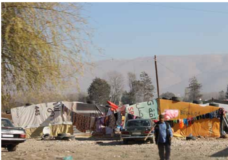
Flüchtlingslager im Libanon von 2015.